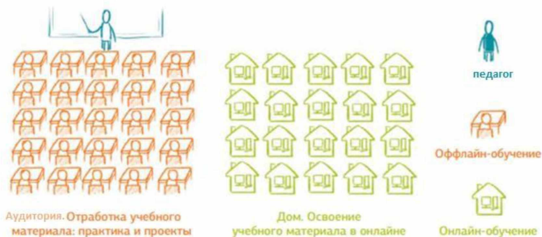
Рис.1 Модель «Перевернутый класс»

Дистанционное обучение используется только в модели «перевернутый класс» (рис.1).